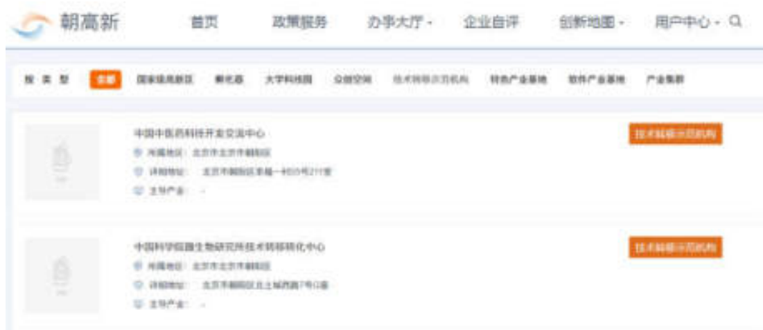
图 8.2 创新载体