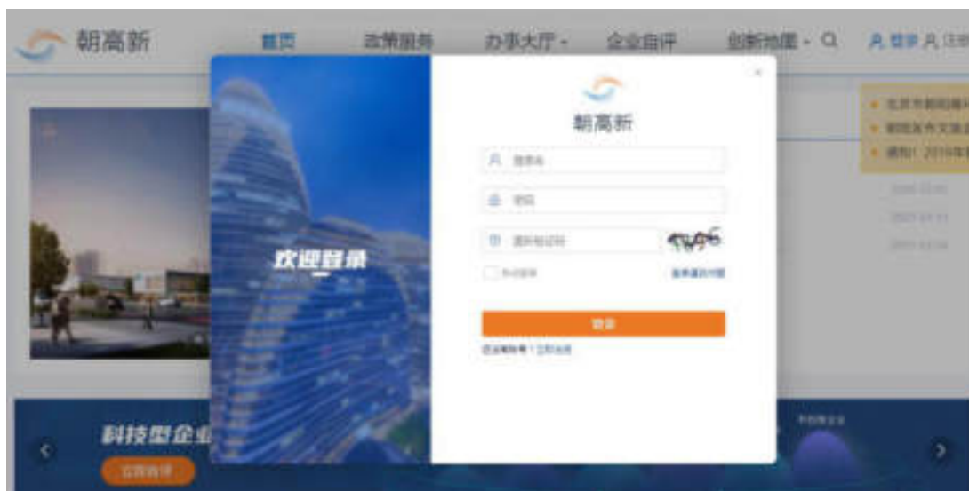
图 2-1 登录页面

进入“朝高新”企业综合服务平台首页，点击右上角“登录”按钮，可进入登录页面，如图：