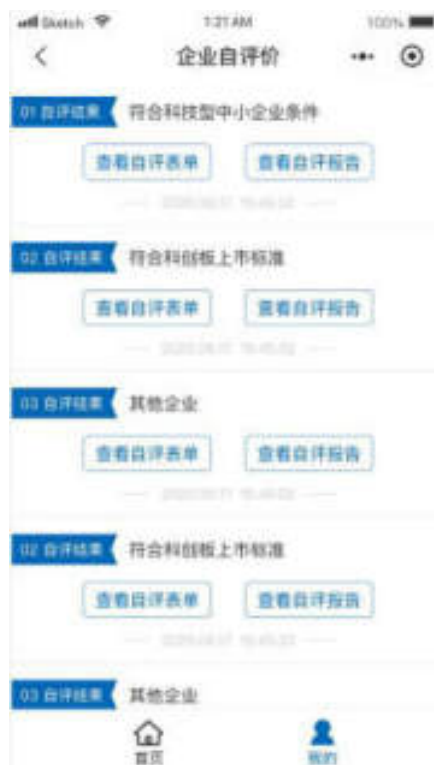
图 10.7-2 小程序企业自评页面

企业自评价列表展示自评结果、自评时间，点击“查看自评表单”按钮，可查看已填写的自评信息。点击“查看自评报告”按钮，可查看平台生成的自评报告。如图：