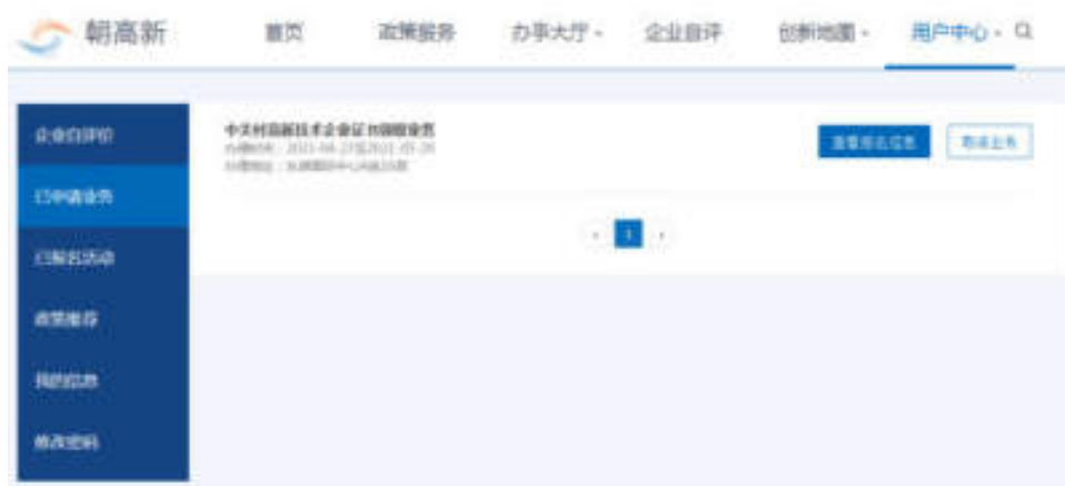
图 9-2 已申请业务

进入用户中心-已申请业务，可查看已申请业务列表，包括业务标题、办理时间、办理地址。点击“查看报名信息”按钮，可查看业务预约信息。点击“取消业务”按钮，可提前一天取消申请办理的业务。如图：