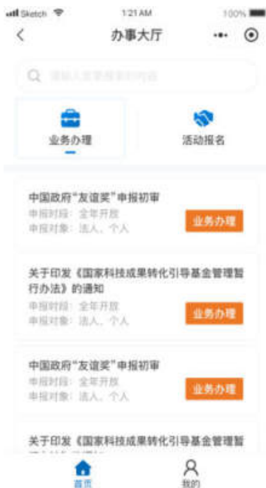
图 10.4.1-1 小程序业务办理页面

进入办事大厅页面，选择“业务办理”，业务列表可按照业务标题进行检索。业务列表展示业务标题、申报时段、申报对象信息，如图：