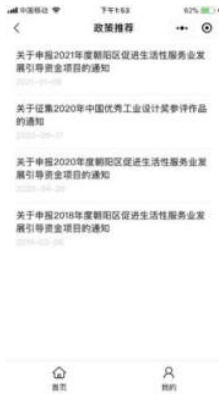
图 10.7-5 小程序推荐政策页面

平台根据企业信息、自评结果为企业推荐相关政策，点击政策标题可查看政策详情， 如图：