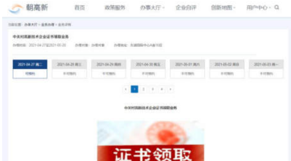
图 6.1-2 业务详情页面

点击“办理业务”按钮，可查看业务详情，包括：业务标题、办理时段、办理对象、办理地址等内容信息，可选择预约时间，如图：