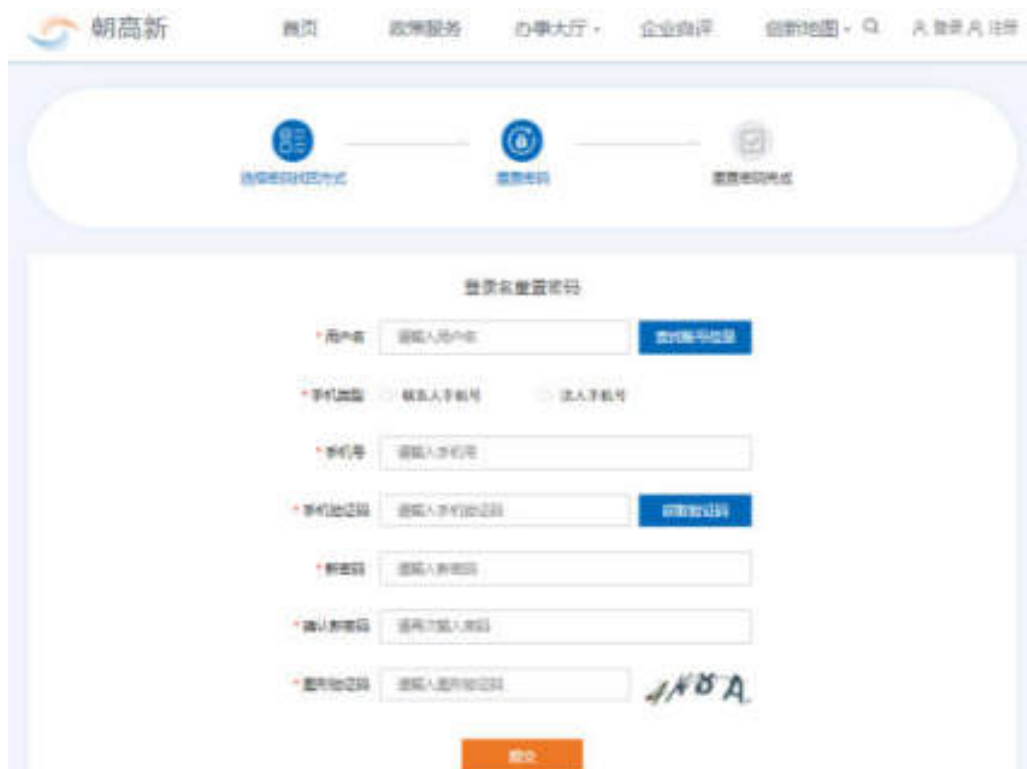
图 3-5 登录名重置密码

选择登录名重置密码后，填写用户名、手机类型、手机号、手机验证码、新密码、确认新密码、图形验证码，点击“提交”按钮，可重置密码。如图：