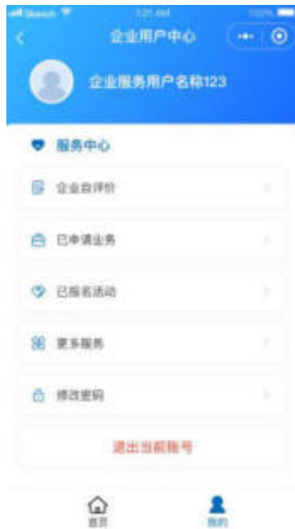
图 10.7-1 小程序用户中心页面