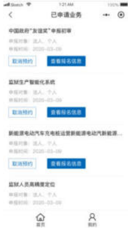
图 10.7-3 小程序已申请业务页面

进入已申请业务页面，可查看已申请业务列表，包括业务标题、申报对象、申报时间。点击“查看报名信息”按钮，可查看预约业务的信息。点击“取消业务”按钮，可提前一天取消申请办理的业务。如图：