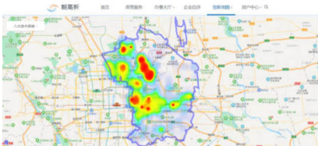
图 8.1 企业热力图

以朝阳区地图的形式展示，对朝阳区高新技术企业进行定位，可按照技术领域进行检索，如图：