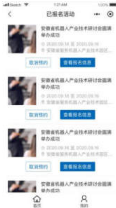
图 10.7-4 小程序已申请活动页面