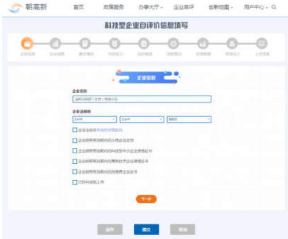
图 7-2 企业信息页面

点击“上一步”按钮，可返回上个页面进行填写。（此页面为第一个填写页面，故没有“上一步”按钮）