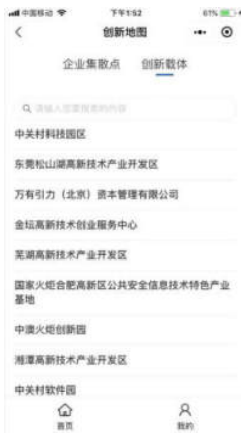
图 10.6.2 小程序创新载体页面