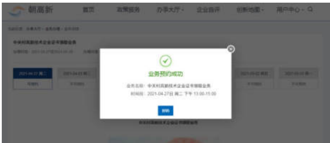
图 6.1-4 业务预约成功页面