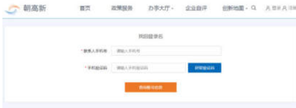
图 3-3 找回登录名页面

选择方式一找回登录名后，需填写联系人手机号、手机验证码，点击“查询账号信息”按钮，方可找回登录名，如图：