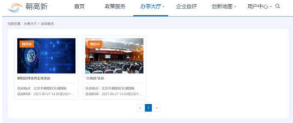
图 6.2-1 活动报名页面