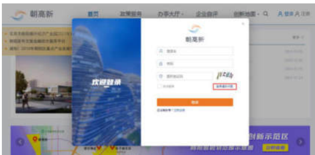
图 3-1 登录遇到问题