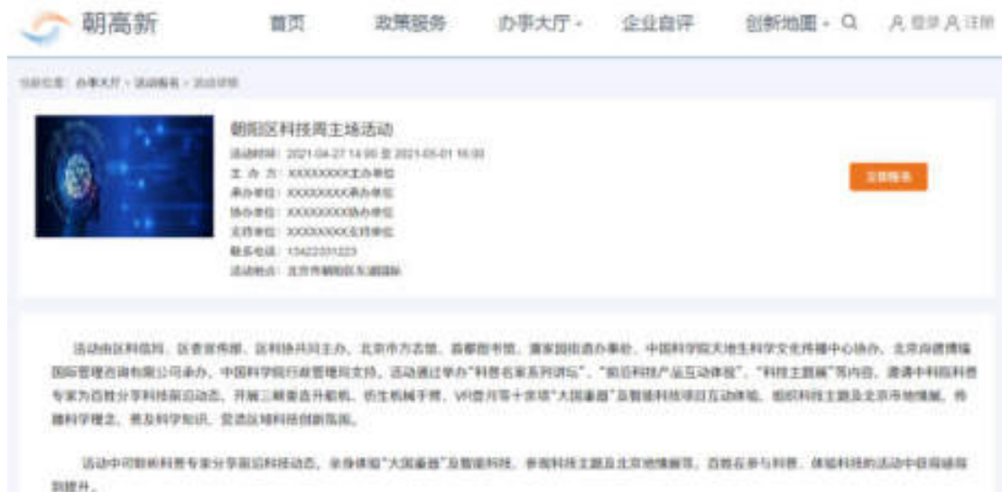
图 6.2-2 活动详情页面