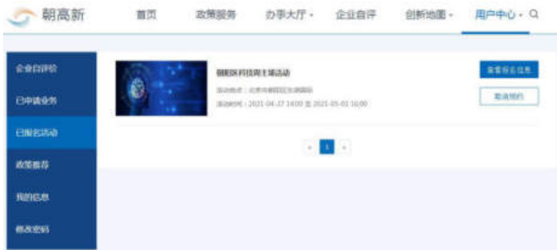
图 9-3 已报名活动

进入用户中心-已报名活动，可查看已报名活动列表，包括：活动图片、活动标题、活动地点、活动时间。点击“查看报名信息”按钮，可查看报名活动的信息。点击“取消预约”按钮，可提前一天取消申请办理的活动。