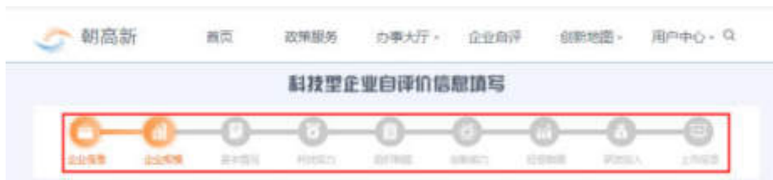
图 7-3 选择页面名称