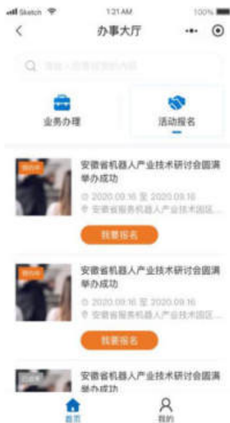
图 10.4.2-1 小程序活动报名页面

进入办事大厅页面，选择“活动报名”，活动列表可根据活动标题进行检索。活动列表中展示活动标题、活动日期、活动地点。如图：