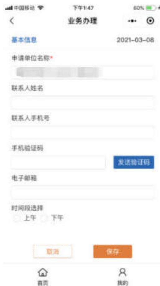
图 10.4.1-3 小程序业务申请页面

选择预约日期后，填写业务申请信息，包括：申请单位名称、联系人姓名、联系人手机号、手机验证码、电子邮箱、时间段选择，如图：