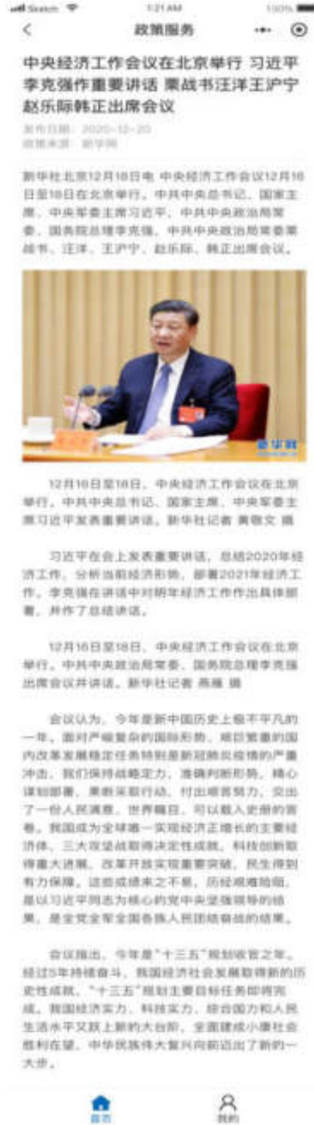
图 10.3-2 小程序政策详情页面

该系统小程序端政策详情页面展示政策标题、政策发布日期、政策来源、政策正文，如图：