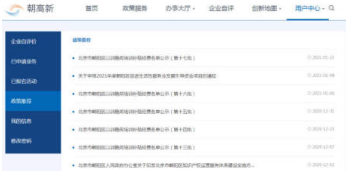
图 9-4 政策推荐

平台根据企业信息、自评结果为企业推荐相关政策，点击政策标题可查看政策详情，如图：