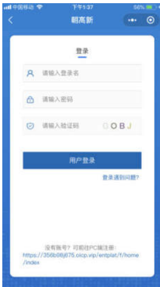
图 10.2 小程序登录页面

进入小程序端首页，点击“我的”，未登录状态进入用户中心，点击“登录”按钮，可进入登录页面。在登录页面，输入登录名、密码、验证码，点击“用户登录”按钮，即可登录。如图：