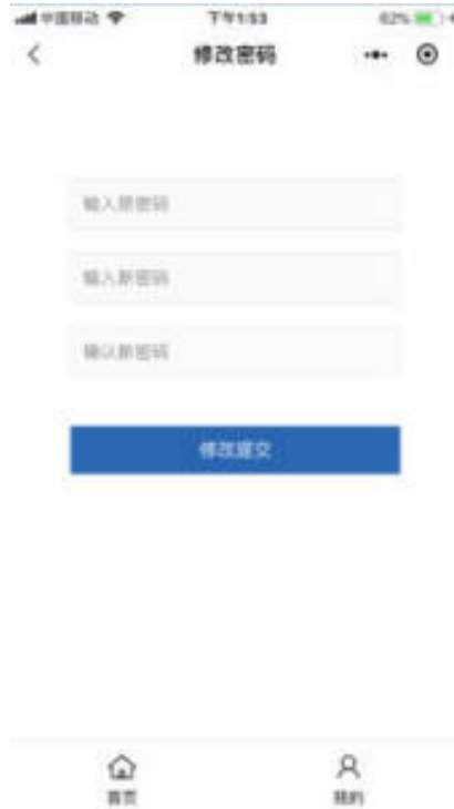
图 10.7-6 小程序修改密码页面

进入用户中心修改密码页面，企业用户输入原密码、新密码、确认新密码后，可修改登录密码，如图：