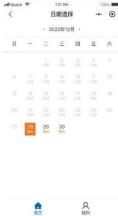
图 10.4.1-2 小程序预约日期页面