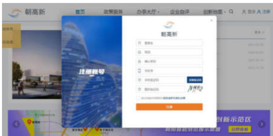
图 2-2 注册页面

若无平台账号，可进入“朝高新”企业综合服务平台首页，点击右上角“注册”按钮注册新账号，如图：