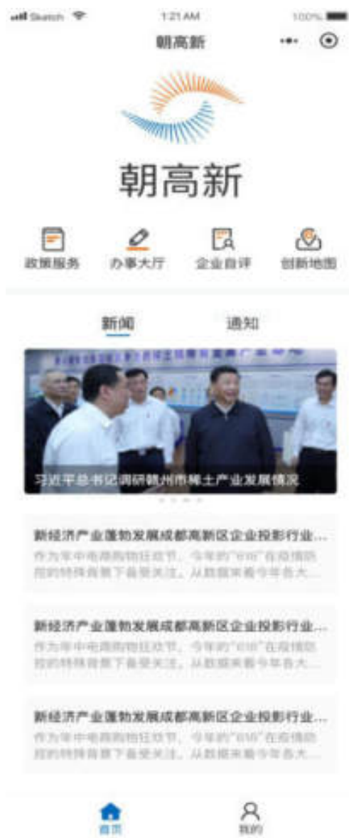
图 10.1 小程序首页

首页包括政策服务、办事大厅、企业自评、创新地图四个模块，并展示新闻、通知列表，如图：