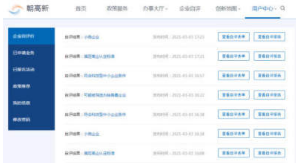
图 9-1 企业自评价

企业自评价列表展示自评结果、自评时间，点击列表中“查看自评表单”按钮，可查看企业自评填写内容。点击“查看自评报告”按钮，可查看生成的自评报告。如图：