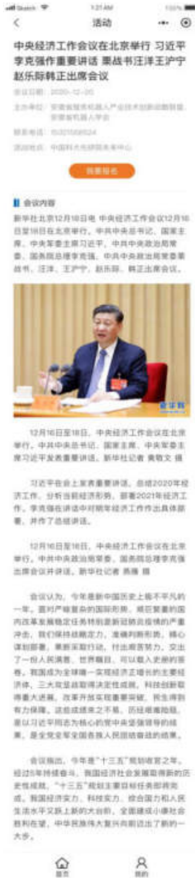
图 10.4.2-2 小程序活动详情页面