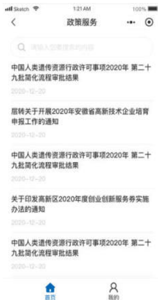
图 10.3-1 小程序政策服务页面

平台小程序端政策服务展示政策列表，可根据政策关键词进行检索，点击政策列表的某一项可进入该项政策的详情页。