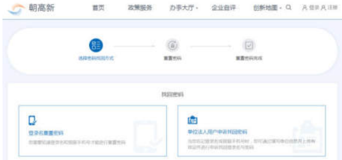
图 3-4 找回密码页面

选择登录名重置密码后，填写用户名、手机类型、手机号、手机验证码、新密码、确认新密码、图形验证码，点击“提交”按钮，可重置密码。如图：