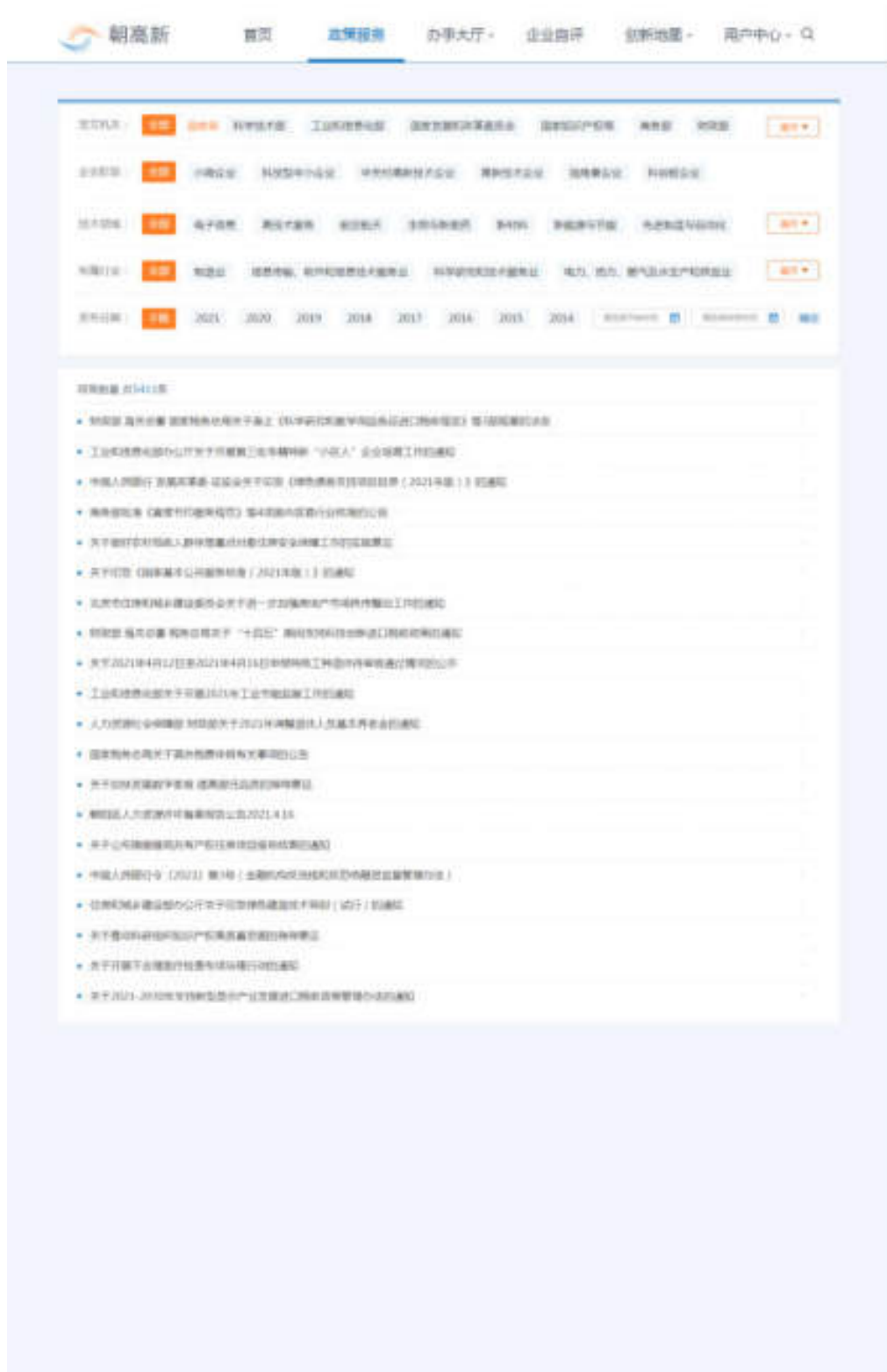
图 5-1 政策服务

政策服务展示政策列表，可按照关键词、发文机关、企业阶段、技术领域、所属行业、发布日期进行搜索，点击政策标题，可进入政策详情查看具体信息，如图：