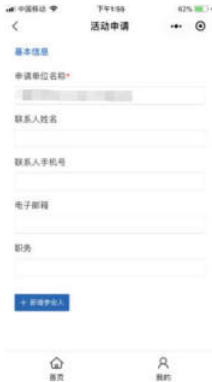
图 10.4.2-3 小程序活动申请页面

点击活动详情“我要报名”按钮，填写活动申请信息，包括：申请单位名称、联系人姓名、联系人手机号、手机验证码、电子邮箱、职务，如图：