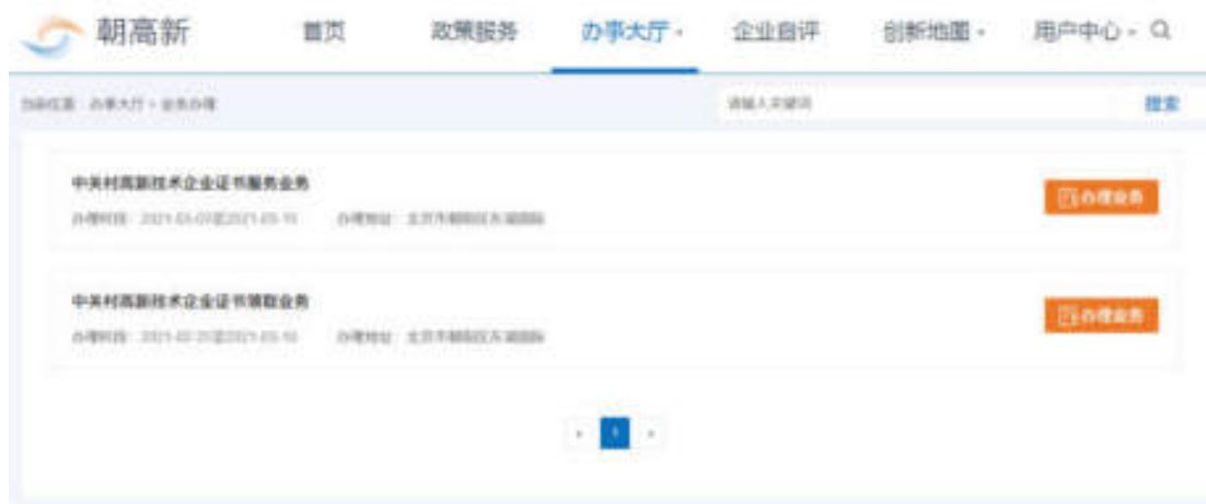
图 6.1-1 业务办理页面

点击“办理业务”按钮，可查看业务详情，包括：业务标题、办理时段、办理对象、办理地址等内容信息，可选择预约时间，如图：