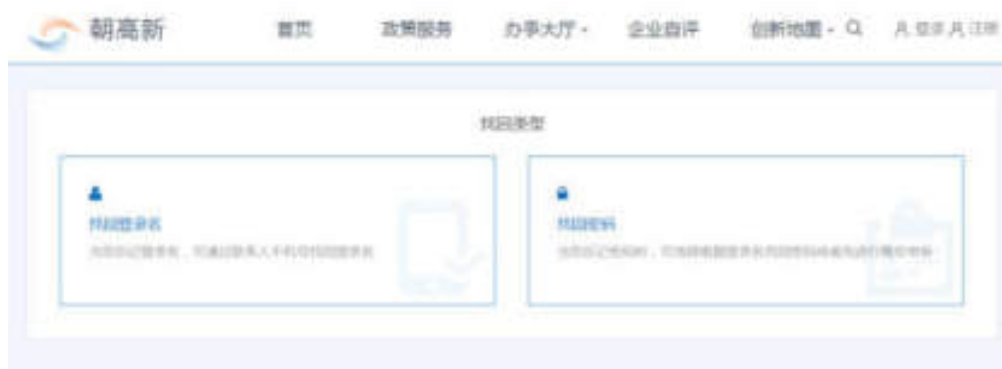
图 3-2 选择找回类型页面

选择方式一找回登录名后，需填写联系人手机号、手机验证码，点击“查询账号信息”按钮，方可找回登录名，如图：