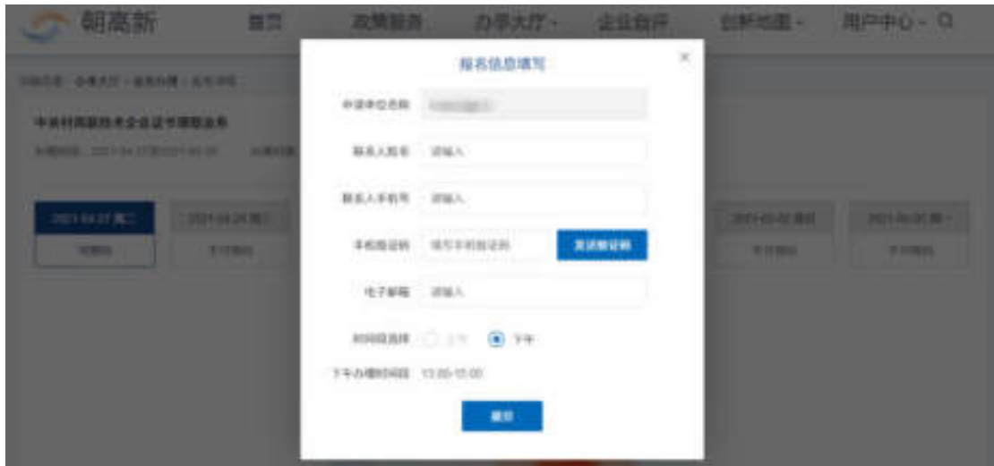
图 6.1-3 业务预约页面

选择预约时间后，可填写业务预约信息，包括申请单位名称、联系人姓名、联系人手机号、手机验证码、电子邮箱、时间段选择，如图：