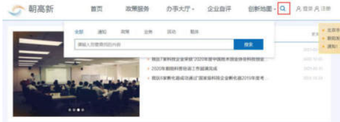
图 1-2 首页搜索

在搜索框中输入关键词，可按照通知、政策、业务、活动、载体进行搜索，搜索结果如图：