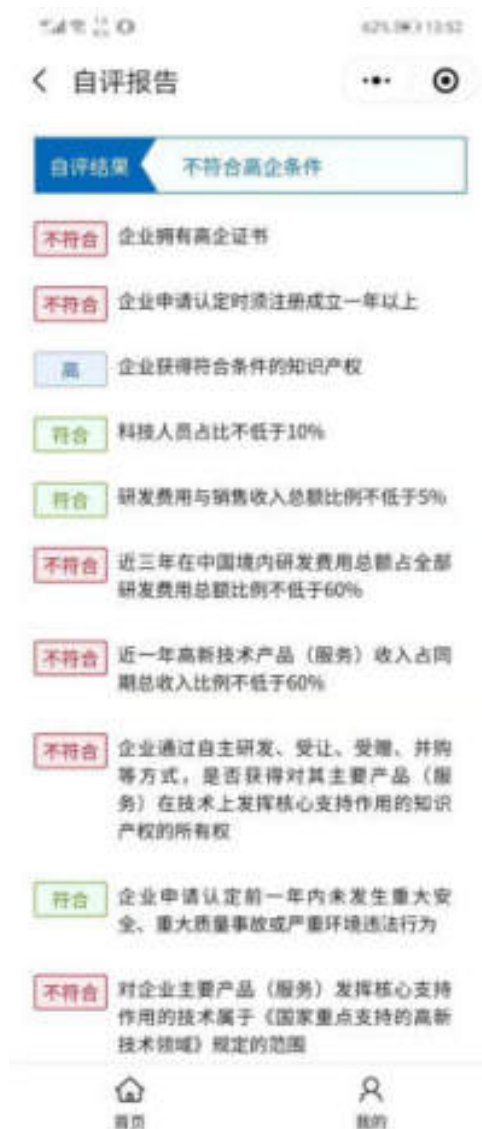
图 10.5-2 小程序企业自评报告页面

企业用户需根据实际情况填写，填写后点击“保存”按钮，平台根据填写内容，给出相应自评报告，如图：