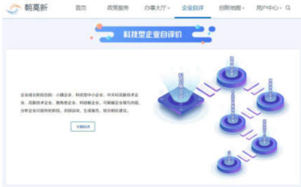
图 7-1 企业自评页面

企业成长阶段包括：小微企业、科技型中小企业、中关村高新技术企业、高新技术企业、独角兽企业、科创板企业。平台可根据企业用户填写内容，分析企业目前所处阶段，识别弱项，生成报告，给出相应建议。