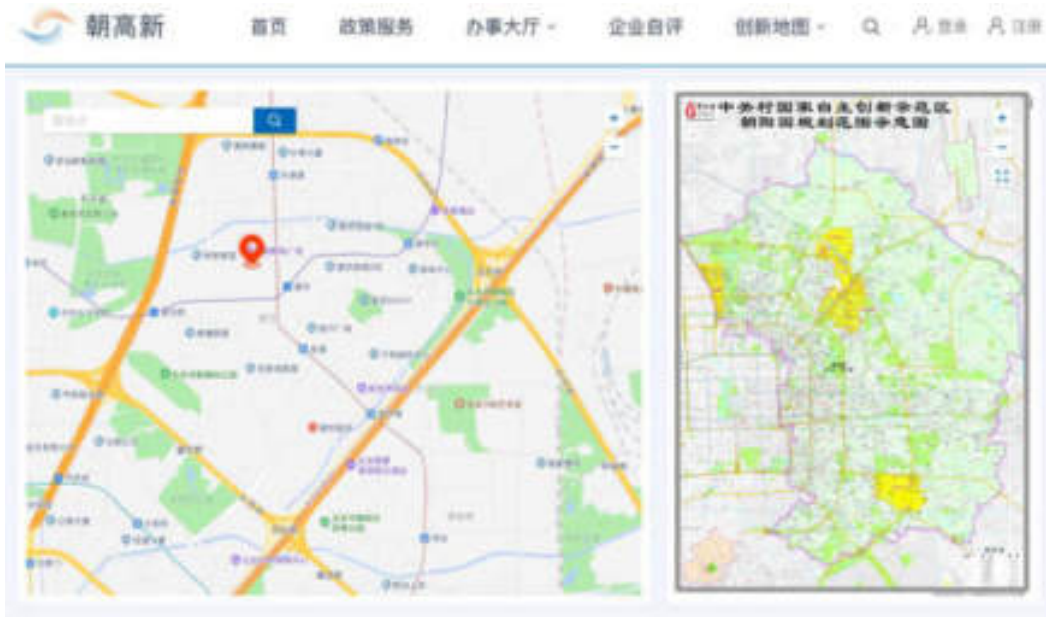
图 4-2 朝阳园规划范围示意图页面

完善企业信息后，点击“提交”按钮，可提交至业务管理员进行审核。审核后“用户中心-我的信息”页面顶部显示审核结果、审核意见，并发送短信进行通知，告知用户审核结果。