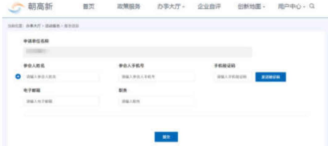
图 6.2-3 活动报名页面

点击“立即报名”按钮，填写报名信息，包括：申请单位名称、参会人姓名、参会人手机号、手机验证码、电子邮箱、职务信息。若有多个参与人，可点击“+”按钮，添加其他参会人信息，如图：