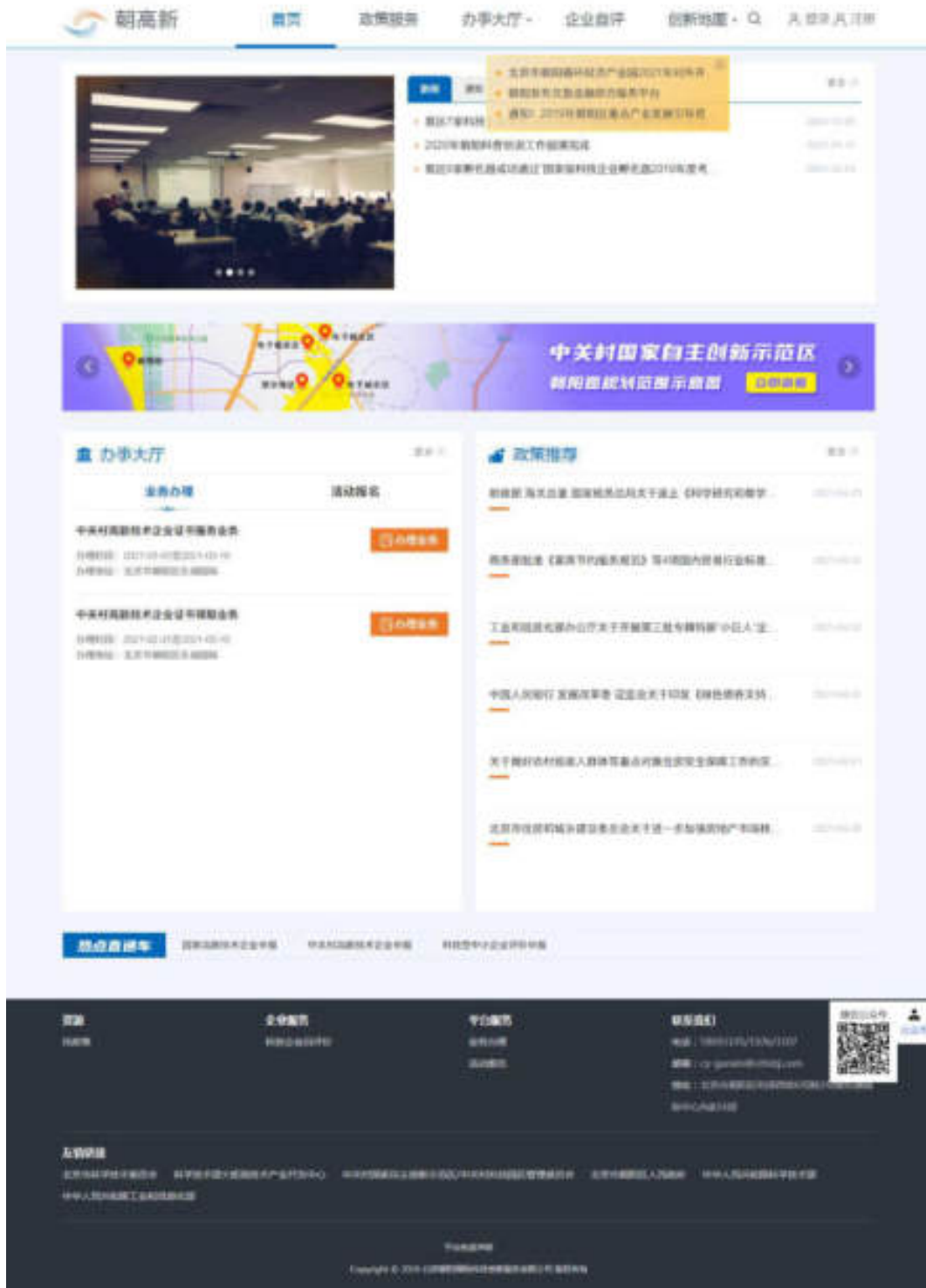
图 1-1 首页

“朝高新”企业综合服务平台首页顶部导航包含首页、政策服务、办事大厅、企业自评、创新地图，点击后可跳转至相应模块。首页展示新闻、通知、办事大厅、政策推荐、热点直通车，且可从首页跳转至科技型企业自评价服务页面、朝阳园规划范围示意图页面，如图：